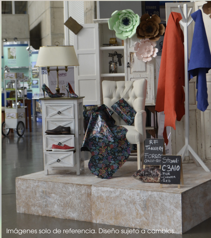
Imágenes solo de referencia. Diseño sujeto a cambios.