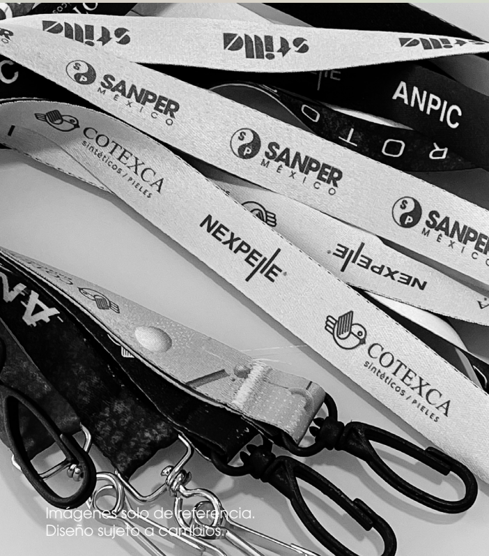
Imágenes solo de referencia. Diseño sujeto a cambios.