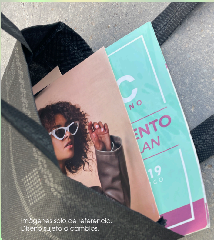
Imágenes solo de referencia. Diseño sujeto a cambios.