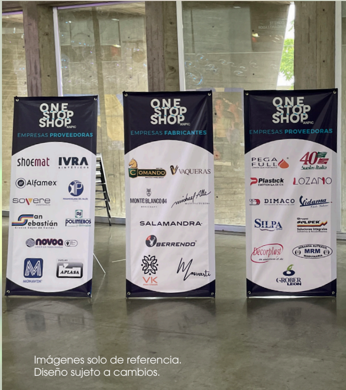
Imágenes solo de referencia. Diseño sujeto a cambios.