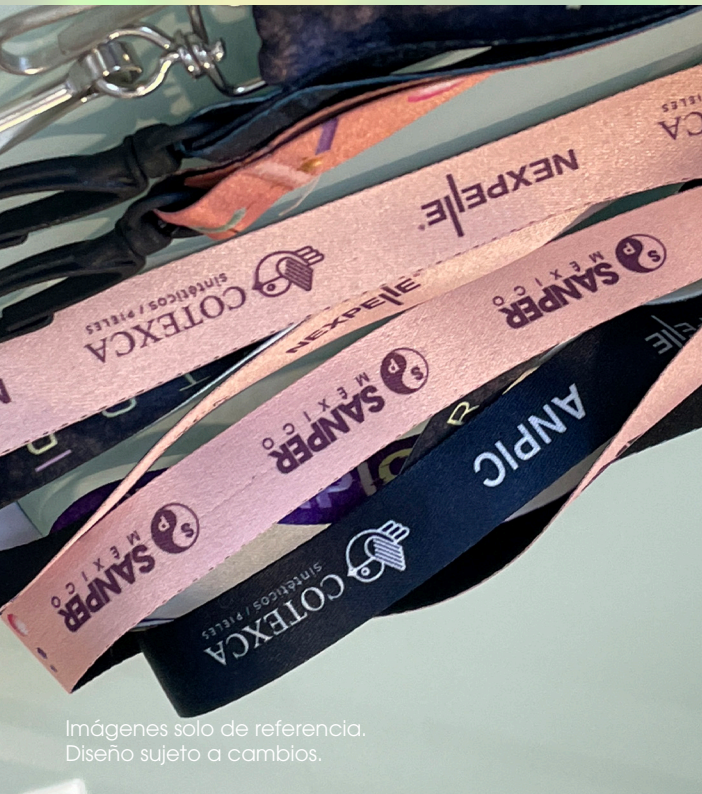
Imágenes solo de referencia. Diseño sujeto a cambios.