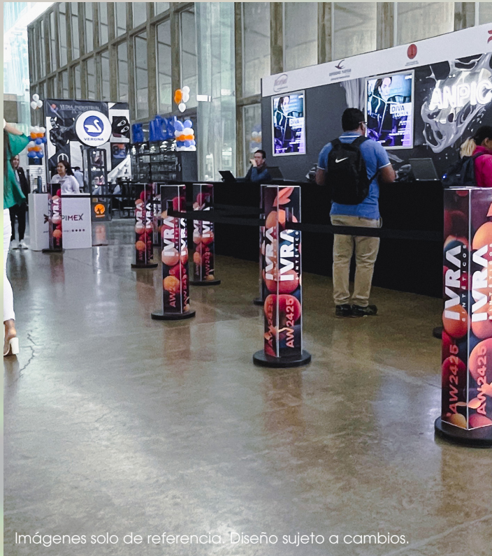
Imágenes solo de referencia. Diseño sujeto a cambios.