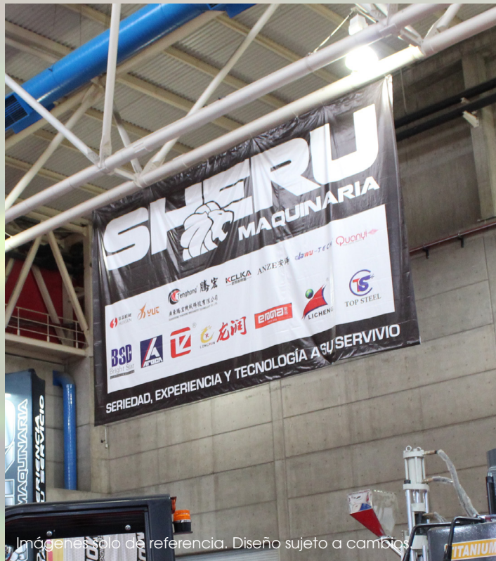
Imágenes solo de referencia. Diseño sujeto a cambios.